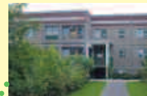
Jugendamt der Stadt Leipzig Kindertagesstätte Eisenbahnstr. 52, 04315 Leipzig