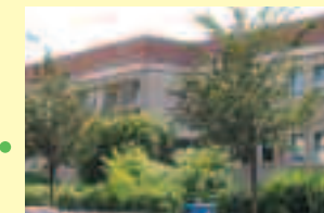
Jugendamt der Stadt Leipzig Kindertagesstätte Konradstr. 70-72, 04315 Leipzig