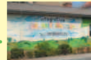
Jugendamt der Stadt Leipzig Kindertagesstätte Hermann-Liebmann-Str. 99, 04315 Leipzig