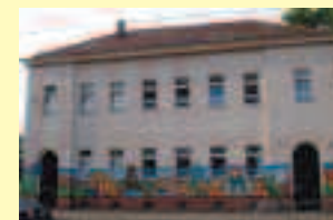
BBW Leipzig Kindertagesstätte Wurzner Str. 122, 04315 Leipzig