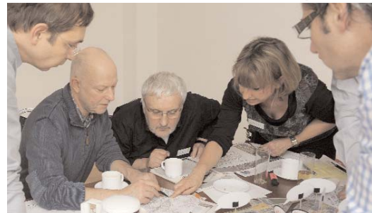
Intensiv arbeiteten die Teilnehmer der Strategiewerkstatt an zukunftsweisenden Ideen für die nächste Entwicklungsetappe des Leipziger Ostens.

Priorität muss künftig verstärkt auf Bildung und Beschäftigung gesetzt werden, wozu unter anderem der Aufbau eines verbindlichen Bildungsnetzwerkes gehört. Besonderes Augenmerk muss dabei der Unterstützung der unter 7-Jährigen gehören.