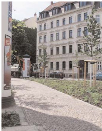
Im Juni 2011 fertig gestellt: die Stadtlandschaften Hermann-Liebmann-Straße mit abwechslungsreichem Grün und neuen Wegen

Im Anschluss an das Grüne Band Wurzner Straße wurde während der zurück liegenden zwölf Monate das langgestreckte Grünareal entlang der Hermann-Liebmann-Straße unter Einbeziehung des markanten Erdwalls behutsam umgestaltet. Vorhandene Bepflanzung wurde weitgehend erhalten und ergänzt sowie ein neuer Weg angelegt.