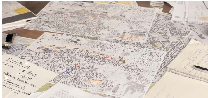
Die Strategiewerkstatt empfiehlt, die lokale Wirtschaft in ihrer Struktur zu erhalten, zu ergänzen und zu erneuern, sowie die Bewohner im Stadtteil für den Arbeitsmarkt zu qualifizieren.

einbart usw. Das Arbeitsladen-Team selbst soll verschiedene Ansätze verfolgen, um das gemeinsame Ziel zu erreichen. So will man in Unternehmen gehen und mit ihnen gemeinsam schlummernde Beschäftigungspotenziale erschließen. Gerade in kleinen Unternehmen kann Personalpolitik häufig nicht im notwendigen Maß betrieben werden. Wer kann sich das leisten? So bleiben Fragen der Arbeitskräfteplanung,