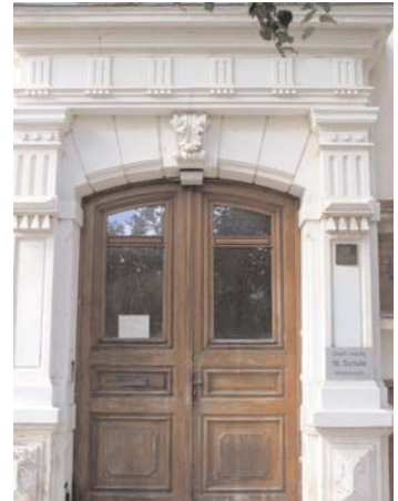
Das Gebäude der 16. Schule muss für eine langfristige, uneingeschränkte Nutzung ertüchtigt werden – mittels Brandschutz-, Sanierungs- und Umbaumaßnahmen.

Damit der Schulbetrieb nicht gestört wird, erfolgen diese Arbeiten überwiegend in den Ferienzeiten.