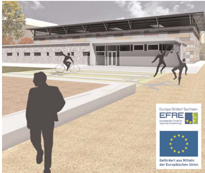
Der vom Architekturbüro Behzadi nach ökologischen Gesichtspunkten konzipierte Hallenneubau wird das Defizit an Sporthallenfläche im Leipziger Osten ein gutes Stück verringern.

Wenn die Halle steht, ermöglicht eine weitere EFRE-Finanzspritze die vollständige Gestaltung der umgebenden Freiflächen, die nahtlos an den benachbarten Park anschließen werden. Auch erforderliche Stell-