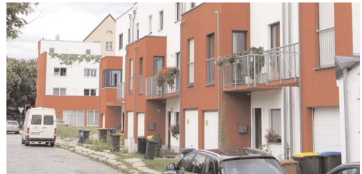
Moderne Stadthäuser in Reihenbauweise prägen bereits das Bild auf der Westseite der Anna-Kuhnnow-Straße. Auf der Ostseite hat der Bau des ersten Stadthauses im Sommer 2011 begonnen.

sehr hohem Grünanteil und nur wenigem nicht störendem Gewerbe insbesondere Familien mit Kindern und individuellen Vorstellungen von einem eigenen Heim an. Die Anna-Kuhnnow-Straße wird außerdem eine direkte Verbindung zwischen den großen Parkanlagen im Stadtteil herstellen: im Norden zum Bernhardiplatz und zum Rabet, im Süden zum Reudnitzer Park und zum Lene-Voigt-Park.