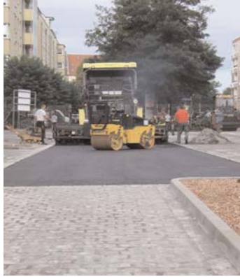
An der Dornbergerstraße: aus einem langjährigen „wilden Parkplatz“ wurde eine attraktiv gestaltete Stellplatzanlage mit besonderer Begrünung

Die Infrastrukturprojekte auf dieser Seite sind Bausteine zur Umsetzung des 2002 beschlossenen Konzeptionellen Stadtteilplans Leipziger Osten.