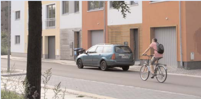
Bereits seit einem Jahr ist das größte Infrastrukturprojekt der aktuellen EFRE-Förderperiode fertig gestellt. Die komplett neu gebaute Straße Rabet bildet jetzt einen ansprechenden, funktionierenden Übergang vom Stadtteilpark Rabet zu den südlich anschließenden Wohnquartieren. Damit erhöht sich auch die Attraktivität der Grundstücke für den vorgesehenen Neubau moderner Stadthäuser in Parkrandlage, ebenso verbessern sich die Bedingungen für den Zuzug neuer Anwohner.